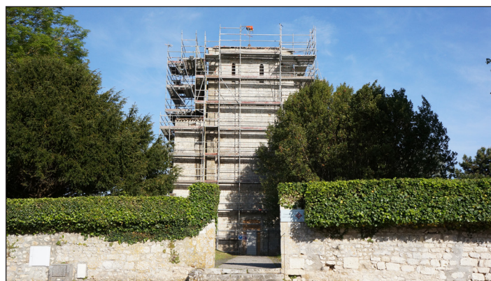
Mai 2019, restauration du clocher