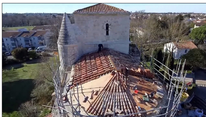
Janvier-février 2019, réfection de la toiture (ph. Artgrafik)

Sources : AT 2015 / Église Saint-Étienne / VAUX-SUR-MER (17). Restauration générale. Février 2016. Architecture Patrimoine & Paysage DODEMAN SARL