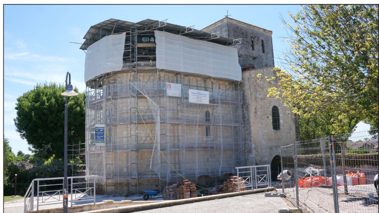
Juin 2018, restauration extérieure du chœur et de l'abside

2020 , restauration et mise en valeur intérieure.